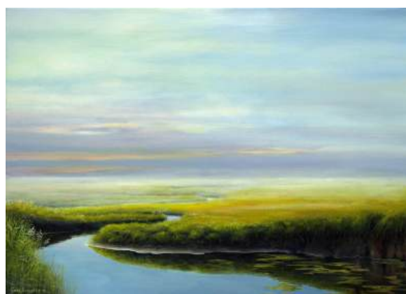
Meander Aa - 50x70 - olie op linnen - 2025