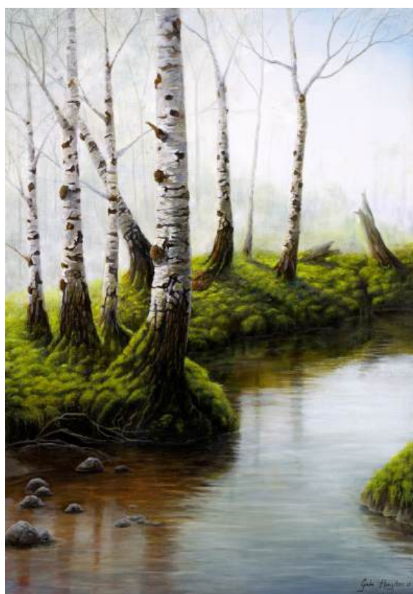
Birch bank - 70x100 olie op linnen 2026 - sold