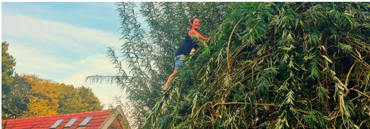
Vlechten van de wilgenhut